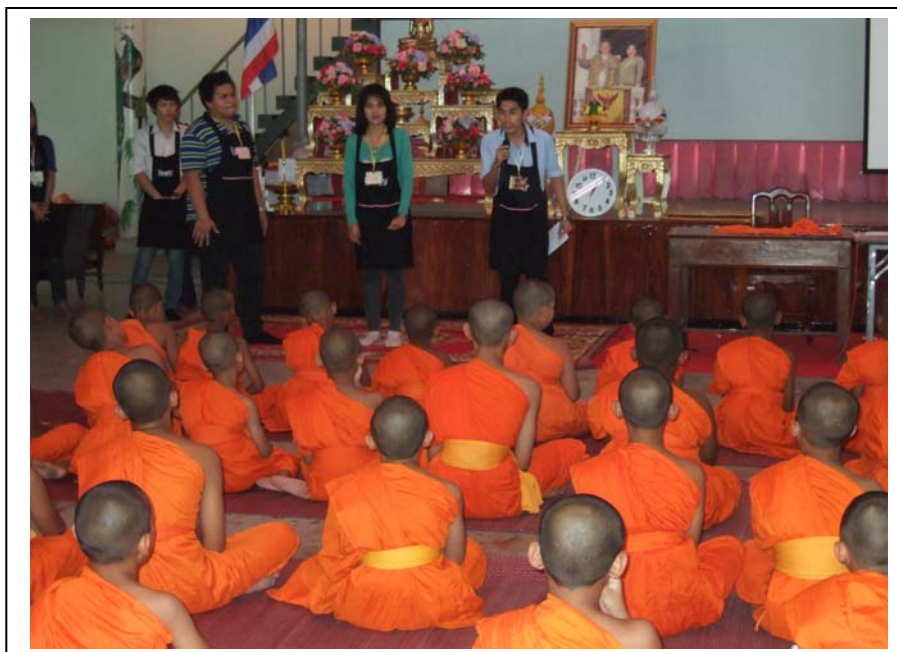
ภาพที่ 1 เตรียมความพร้อมและแบ่งฐานกิจกรรม