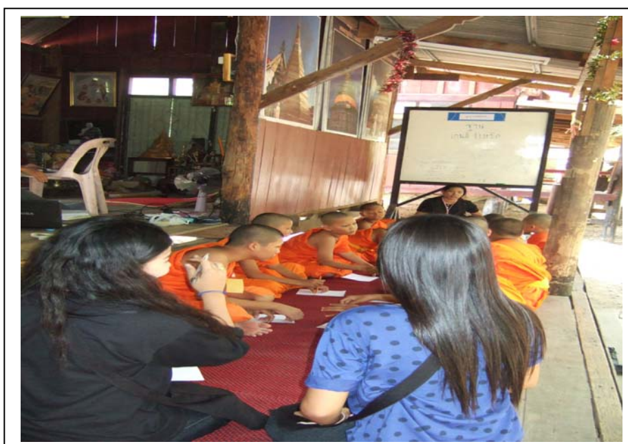
ภาพที่ 2 ฐานเกมจังหวัด