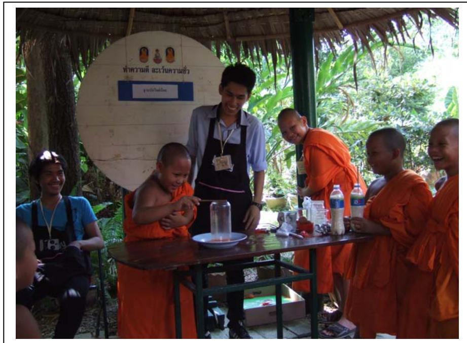
ภาพที่ 5 ฐานนักวิทย์น้อย