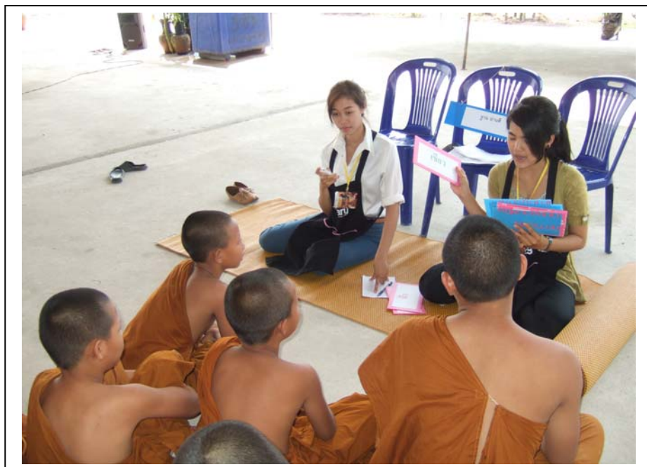
ภาพที่ 14 ฐานอ่านสี่