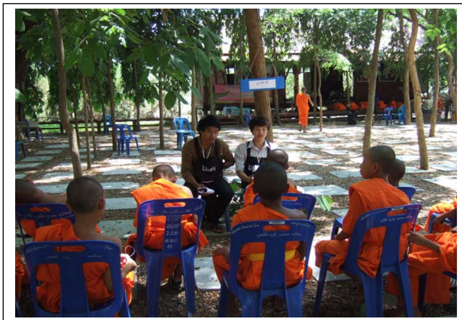
ภาพที่ 3 ฐานสีล 10