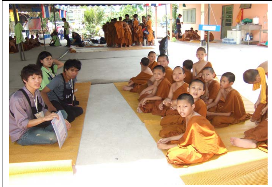
ภาพที่ 11 ฐานศิลป์ 10