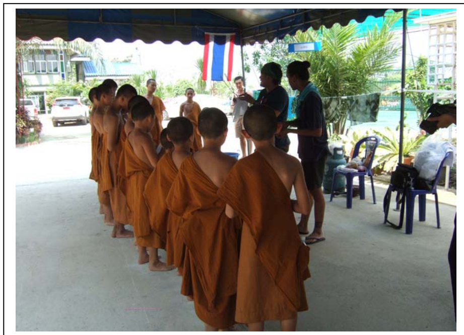
ภาพที่ 12 ฐานสี่ศิลป์