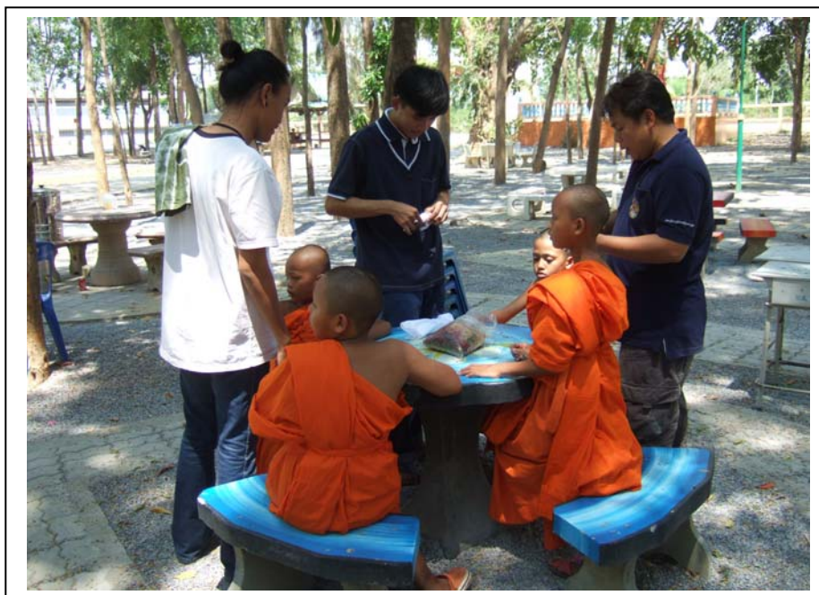
ภาพที่ 4 ฐานสีศิลป์