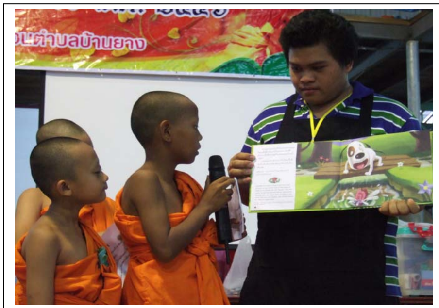
ภาพที่ 8 กิจกรรมเล่านิทาน