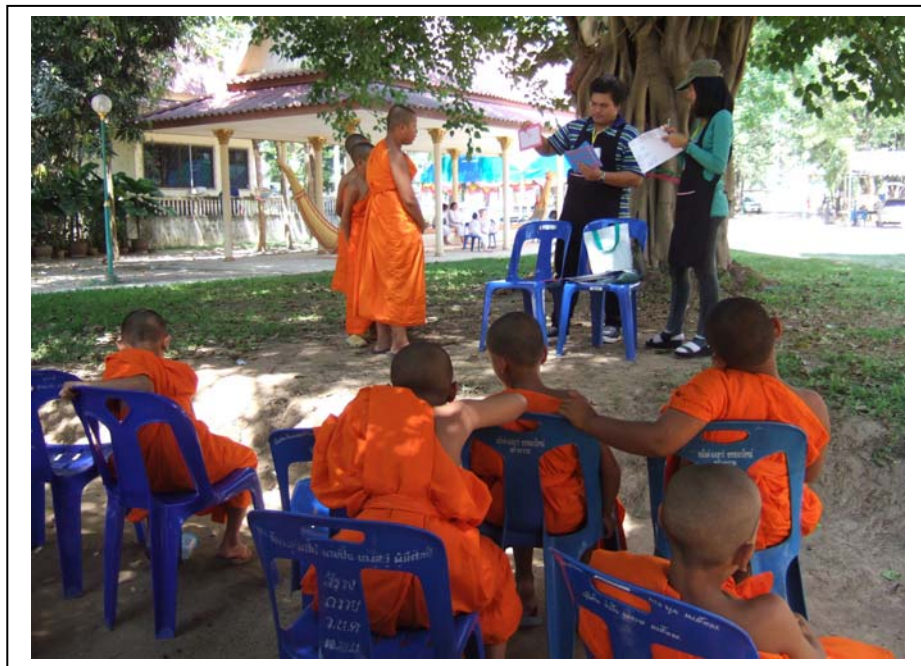
ภาพที่ 6 ฐานอ่านสี่