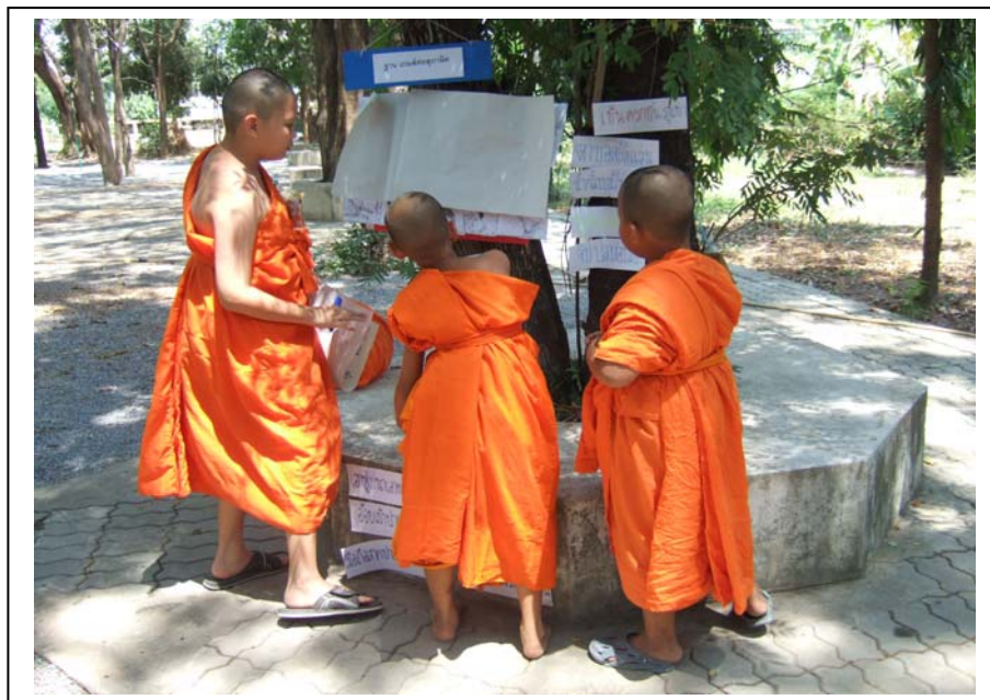
ภาพที่ 7 ฐานสุภาชิต