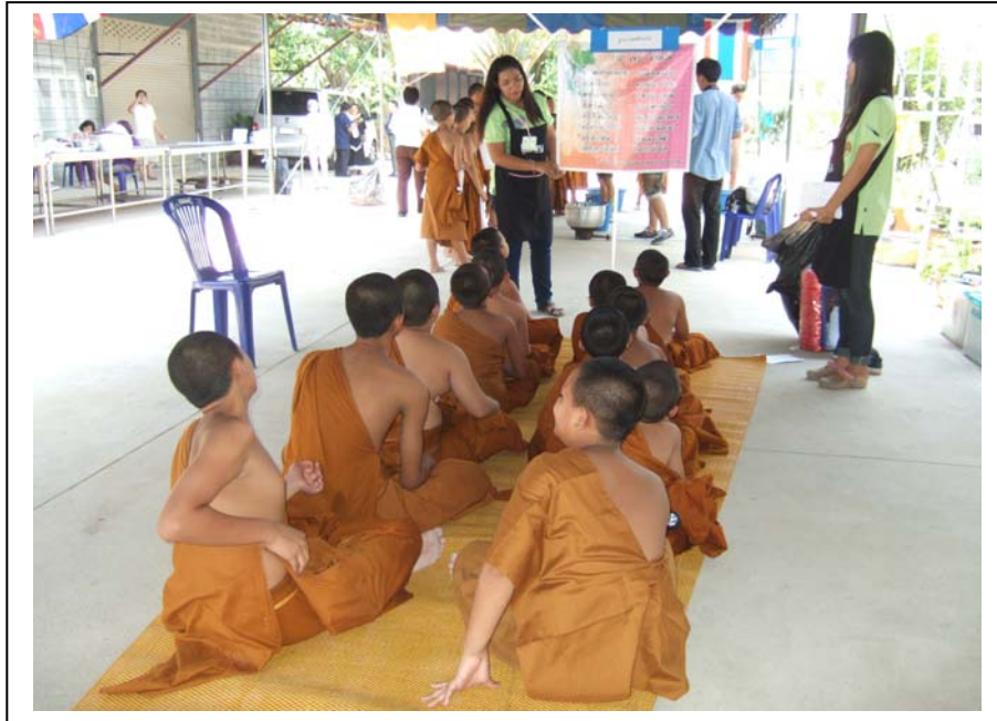
ภาพที่ 9 ฐานทายจังหวัด