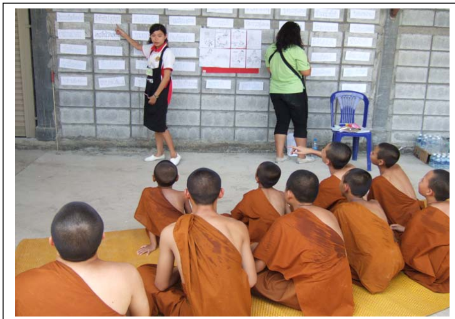
ภาพที่ 10 ฐานสุภาษิต