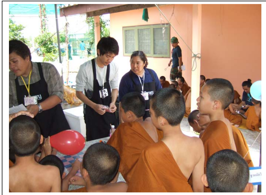
ภาพที่ 13 ฐานนักวิทย์น้อย