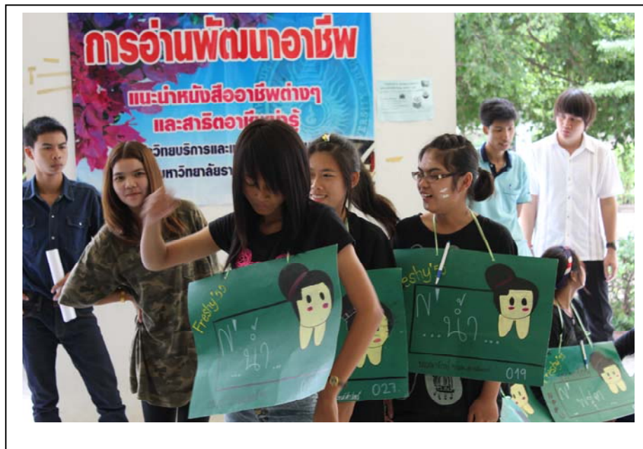
ภาพที่ 7 กิจกรรมสานสัมพันธ์น้อง-พี่