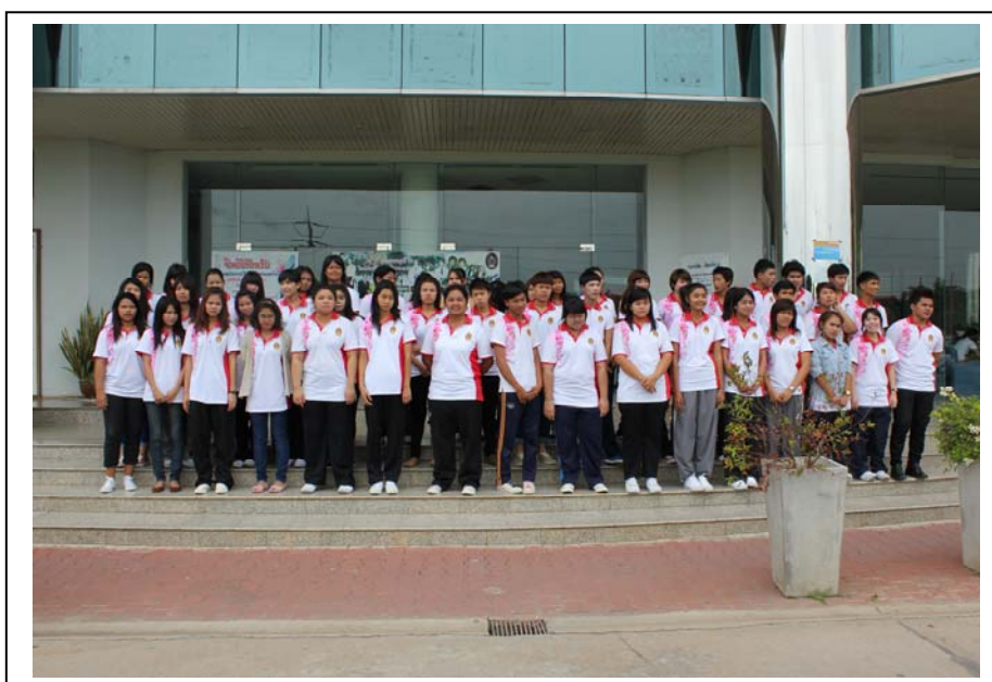
ภาพที่ 2 ถ่ายภาพรวมหมู่เรียน 55/76