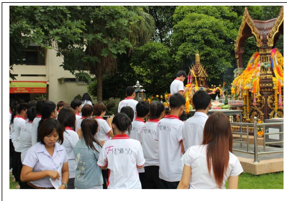
ภาพที่ 1 ไหว้สักการะสิ่งศักดิ์สิทธิ์ประจำมหาวิทยาลัย