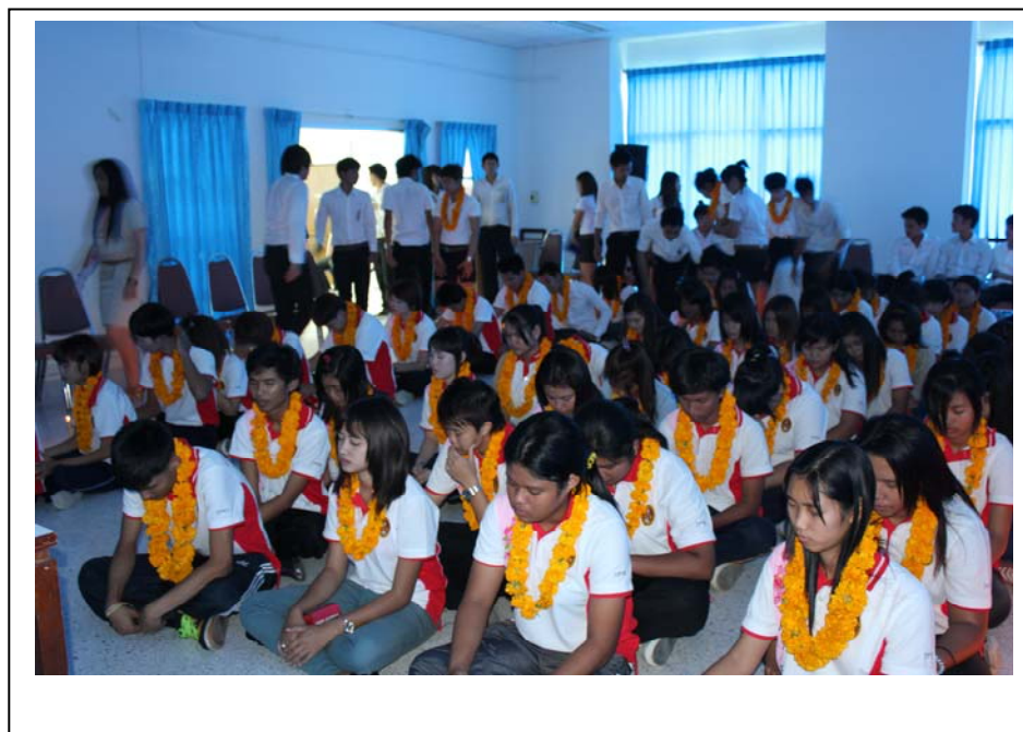
ภาพที่ 6 เตรียมความพร้อมเพื่อเข้าสู่พิธีกรรม