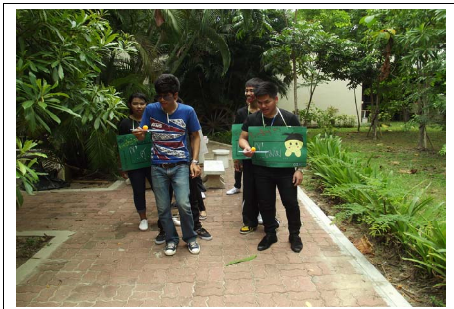
ภาพที่ 8 กิจกรรมสร้างทักษะการเรียนรู้