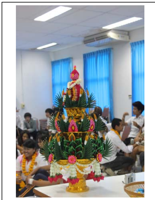
ภาพที่ 3 พานบายศรี