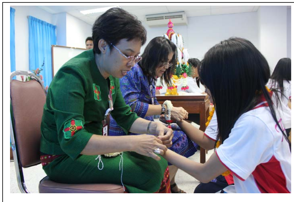
ภาพที่ 4 อาจารย์ผูกข้อมือและให้พร