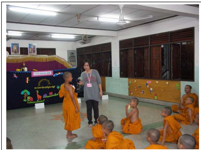
ภาพที่ ๑๒ กิจกรรมท่ายปัญหาและรับของรางวัล