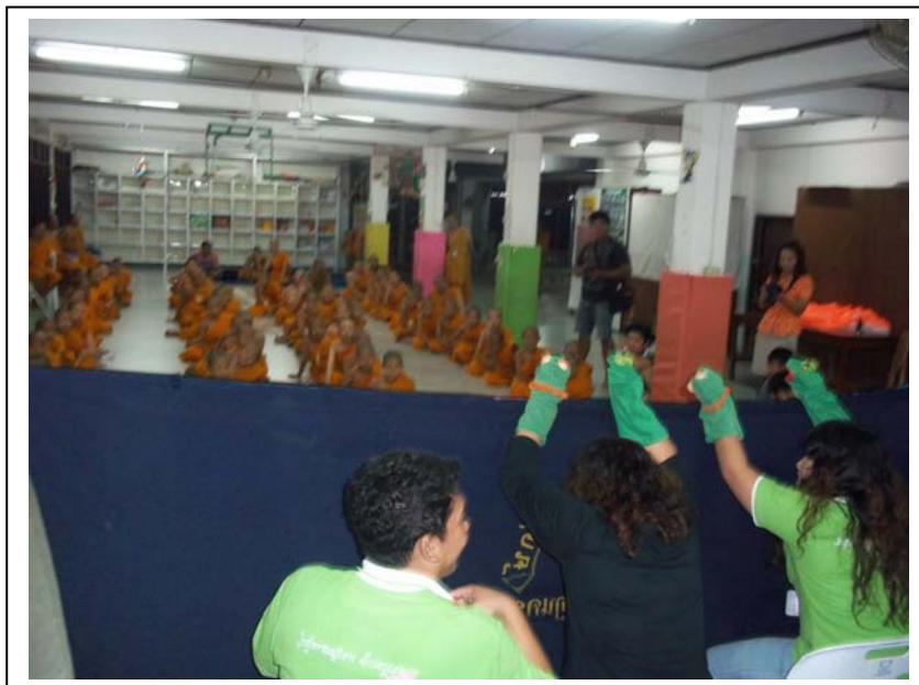
ภาพที่ ๑๑ กิจกรรมเชิดหุ่น