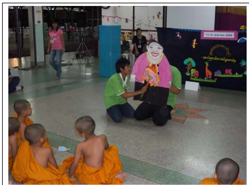
ภาพที่ ๑๐ กิจกรรมเล่นนิทาน