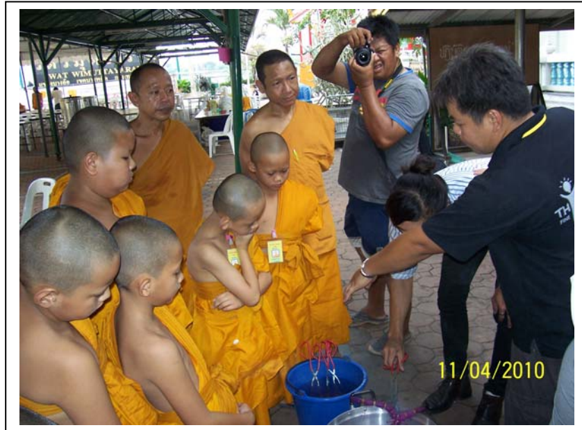
ภาพที่ ๗ ฐานสี่ศิลป์ วิทยากรโดยเก่งกาจ ต้นทองคำ และนักศึกษาศิลปกรรม