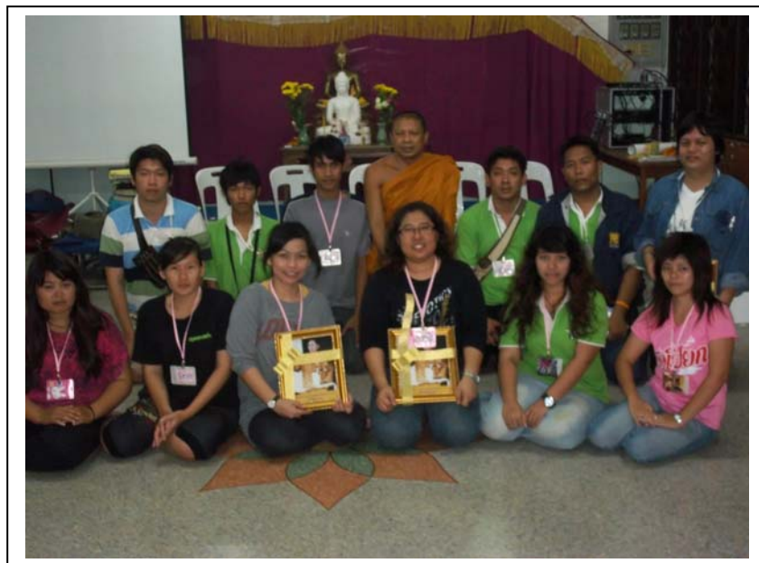
ภาพที่ ๑๔ ร่วมถ่ายภาพ